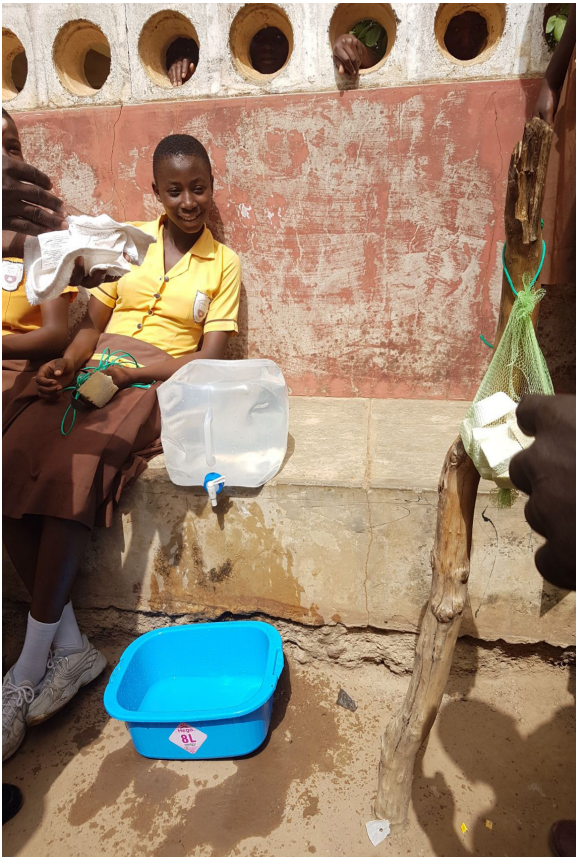
Imagen 9: Niños recibiendo clases de higiene

En este proyecto se explican las técnicas de un buen lavado de manos, así como la importancia de cuándo y por qué nos las lavamos, y se enseña a hacer pastillas de jabón artificialmente.