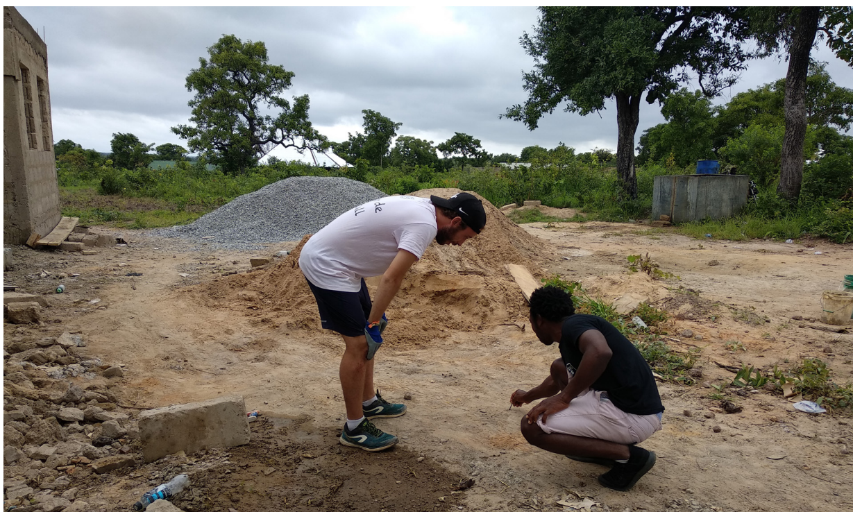
Imagen 5. El futuro campo base de NASCO en Sawla cogiendo forma.