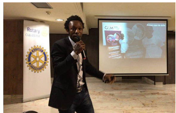
Imagen 15: Charla en el Rotary Club

28 de abril: Charla en una de nuestras escuelas de Ghana juntamente con Oscar Camps de Open Arms. La idea clave está clara: educar, informar y concienciar más .