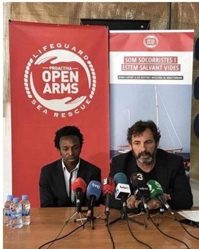
Imagen 11: Rueda de prensa de NASCO y Open Arms

En este 7º año comenzamos una colaboración con Open Arms en el mes de abril, para reforzar todavía más nuestro mensaje. Sin embargo, después de 6 meses de colaboración, nos vimos obligados a poner fin a este acuerdo, ya que la misión principal de NASCO no es salvar vidas en el mar sino en el lugar de origen. Creemos que tenemos que centrar todos nuestros esfuerzos en esta tarea, ya que el hecho de que el fundador de NASCO sea de Ghana nos permite conocer en mucha profundidad las necesidades del país, y eso hace que nuestra labor sea mucho más eficiente y eficaz en este contexto.