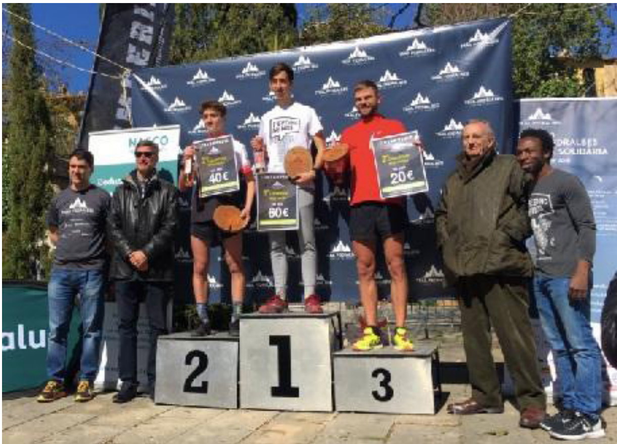
Imagen 6. Los ganadores de la carrera

Por primera vez se vendieron los 500 tiquets de la carrera, y por tanto estamos un paso más cerca de acabar la casa de voluntarios que estamos construyendo en Ghana. La televisión de TV3 grabó la carrera y la emitió en el canal 3/24. Además, el diario 'El Mundo' escribió un pequeño artículo sobre la carrera solidaria de NASCO.