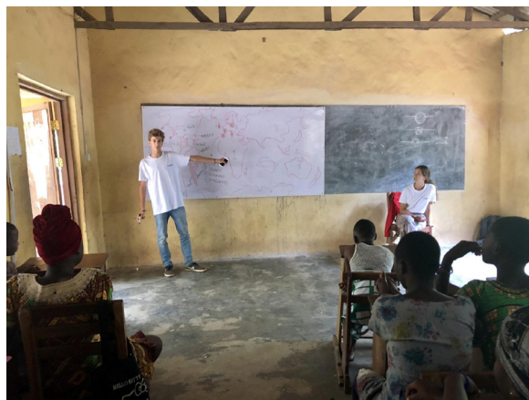
Imagen 7. Voluntarios de NASCO durante su estancia en Ghana en varias aulas ICT.