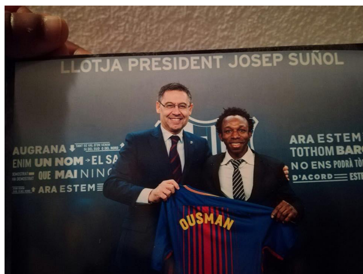
Imagen 12: Acuerdo con el FCB

21 de febrero: Fiesta en Sarrià en el bar Sotavent para obtener fondos para nuestros proyectos de Ghana. Recaudamos más de 2.000€.