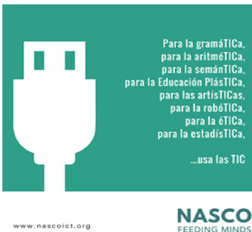
Imagen 2: Las TIC por NASCO

Llevamos ya 7 años respondiendo con la mejor voluntad a la raíz de estas situaciones en Ghana. Con nuestra acción hemos llegado hasta 11.000 alumnos. Si creíamos que el año 2017 había sido un año de crecimiento, consolidación e incluso reconocimiento público, este 2018 se ha realizado un esfuerzo todavía más grande en esta dirección. La colaboración con Open Arms nos ha dado a conocer, y hemos aparecido en medios de mucha más envergadura, entre ellos La Vanguardia, El País, El Mundo, La Razón, etc.