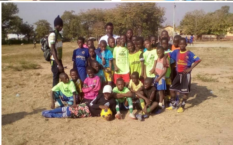
Imagen 17, 18 y 19: Encuentros importantes