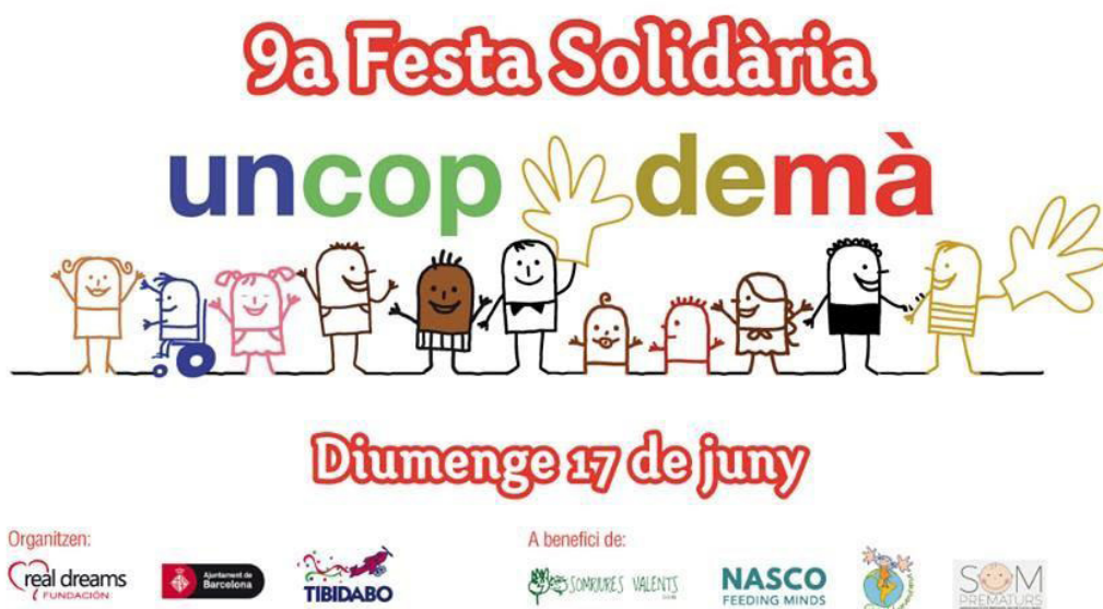
Imagen 16: Cartel 9a Fiesta Solidaria

19 de junio: Participamos en los Premios que cada año organiza la asociación Mi grano de arena . Ousman explicó su historia durante el acto de entrega de los premios.