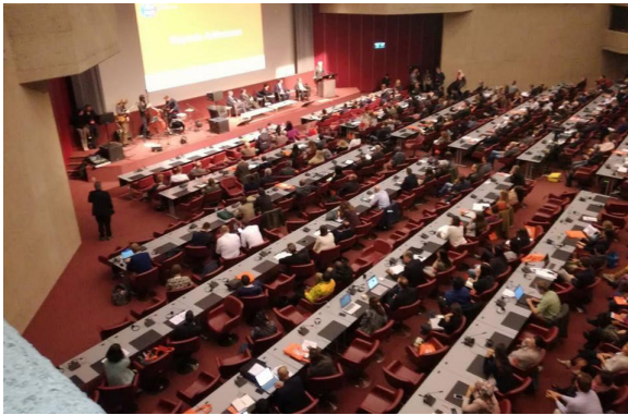
Imagen 14: Foro de la salud

17 de abril: Asistencia a Ginebra en el Foro de la Salud, lugar en el que se tratan las prácticas más innovadoras en el campo de la salud a nivel internacional. Nosotros explicamos como hemos implementado los talleres de higiene básica para prevenir enfermedades como la fiebre tifo-