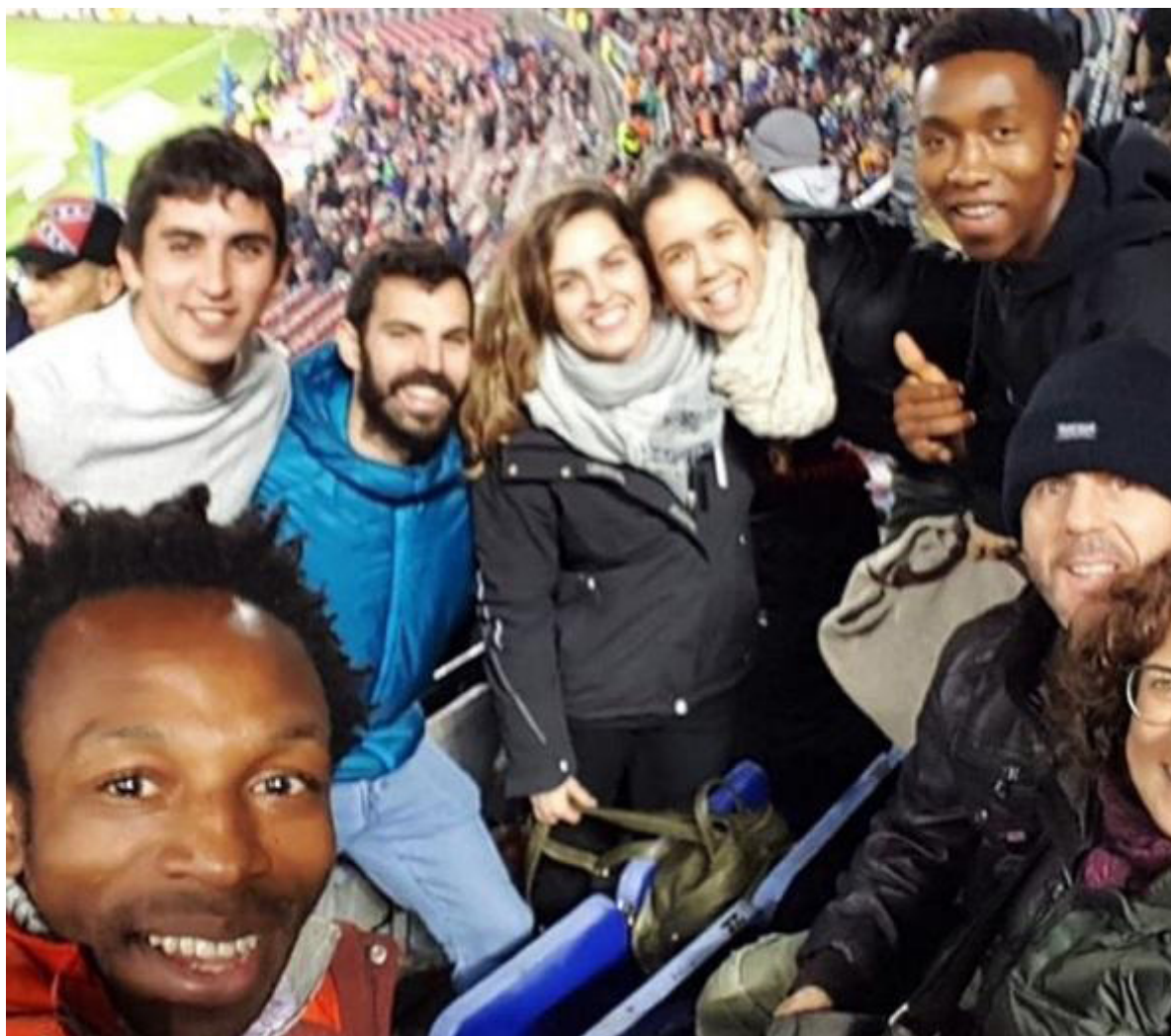
Imagen 21: El día del socio en el Camp Nou, con voluntarios.

Charla cocktail al Círculo de Alemanes en el Círculo Ecuéstre.