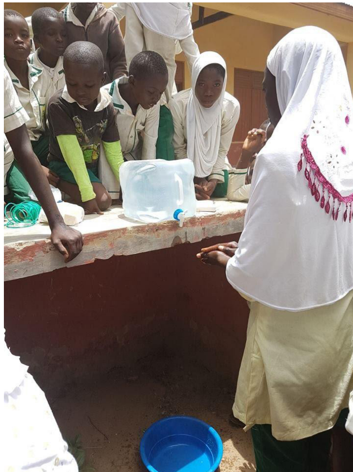
Imagen 13: Taller de higiene básica

27 de marzo: La higiene básica es fundamental para evitar enfermedades graves como la fiebre tifoidea o las gastroenteritis. En este día pusimos en marcha nuestro primer taller organizado por nuestra comisión médica.