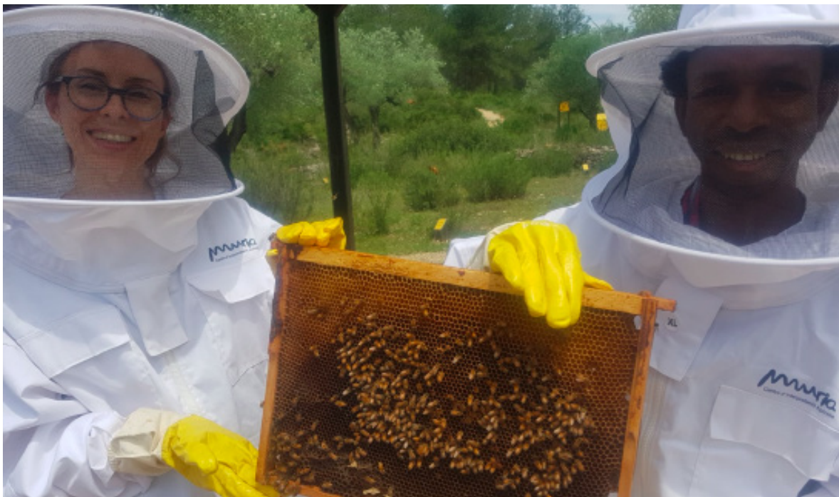
Imagen 8. Ousman en un poblado cercano a Sawla trabajando en el proyecto de la miel

tas de apicultor, donde se colaban las abejas. Eso ocasionó que muchas mujeres dejaran de trabajar en el proyecto porque no veían buenos resultados. En el verano de 2018, los voluntarios llevaron nuevos trajes y guantes. Además, arreglaron y limpiaron las cajas de abejas que estaban amontonadas en un desván. El proyecto se reforzó mucho y actualmente se encuentra en perfecto funcionamiento. Las madres lo aprovechan y venden la miel para que sus hijos puedan recibir educación.