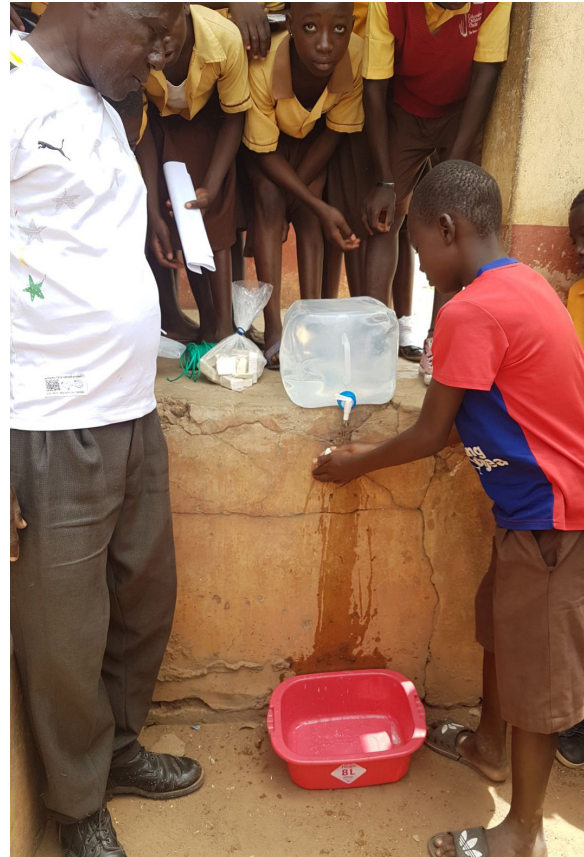
Imagen 10: Voluntario junto a un enfermero en Sawla